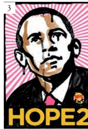
Figure 3, 4 Alcune delle trasformazioni dell'immagine “Hobama Hope” nella circolazione sul Web. Google . Obama Hope. Immagini. [visitato 6 gennaio 2016]. Disponibile da: https://www.google.it/search?q=obama+hope&safe=active&biw=1600&bih=799&ctbm=isch&tbo=u&source=univ&sa=X&sqi=2&ved=0ahUKEwj8pdewJDKAhXJBoKHcXoD_AQ7AkIMQ#imgrc=qQpOzTz305kjqM%3A

Figures 3, 4 Some image's “Hobama Hope” trasformations, circulating on the Web. Google . Obama Hope. Immagini. [visited January 6, 2016]. Available by: https://www.google.it/search?q=obama+hope&safe=active&biw=1600&bih=799&ctbm=isch&tbo=u&source=univ&sa=X&sqi=2&ved=0ahUKEwj8pdewJDKAhXJBoKHcXoD_AQ7AkIMQ#imgrc=qQpOzTz305kjqM%3A