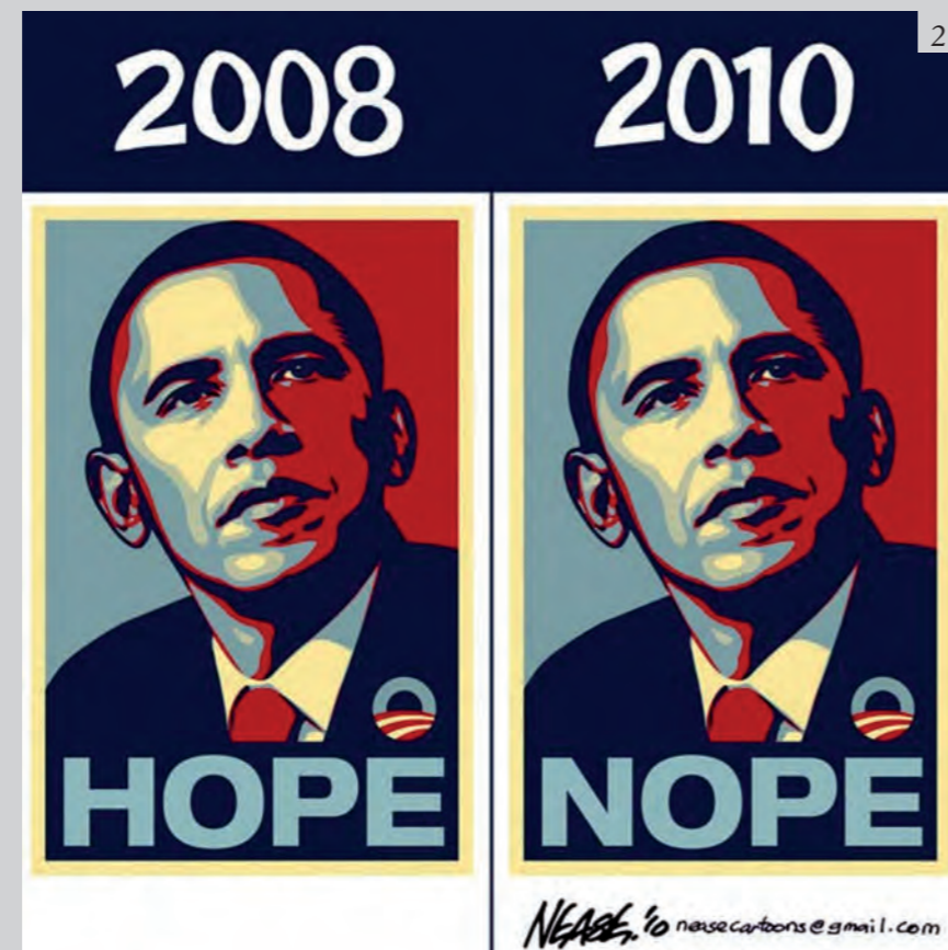
Figura 2 Alcune delle trasformazioni dell'immagine “Hobama Hope” nella circolazione sul Web. Google . Obama Hope. Immagini. [visitato 6 gennaio 2016]. Disponibile da: https://www.google.it/search?q=obama+hope&safe=active&biw=1600&bih=799&tbm=isch&tbo=u&source=univ&sa=X&sqi=2&ved=0ahUKEwj8pdewJDKAhXJB0KHCXoD_AQ7AkIMQ#imgrc=qPpOzTz305kjqM%3A

Figure 2 Some image's “Hobama Hope” trasformations, circulating on the Web. Google . Obama Hope. Immagini. [visited January 6, 2016]. Available by: https://www.google.it/search?q=obama+hope&safe=active&biw=1600&bih=799&tbm=isch&tbo=u&source=univ&sa=X&sqi=2&ved=0ahUKEwj8pdewJDKAhXJB0KHCXoD_AQ7AkIMQ#imgrc=qPpOzTz305kjqM%3A