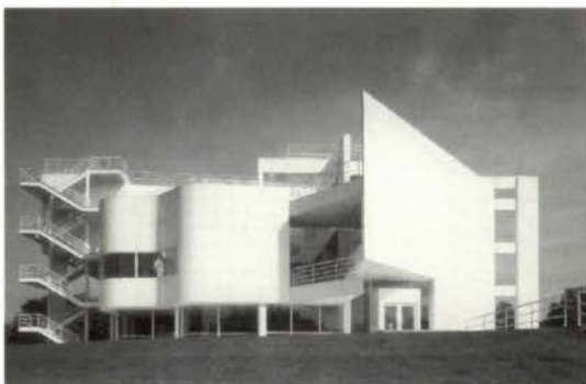
2. The Abeneum, New Harmony, Indiana 1975-79.